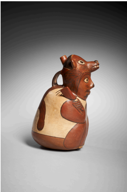
Fig. 3