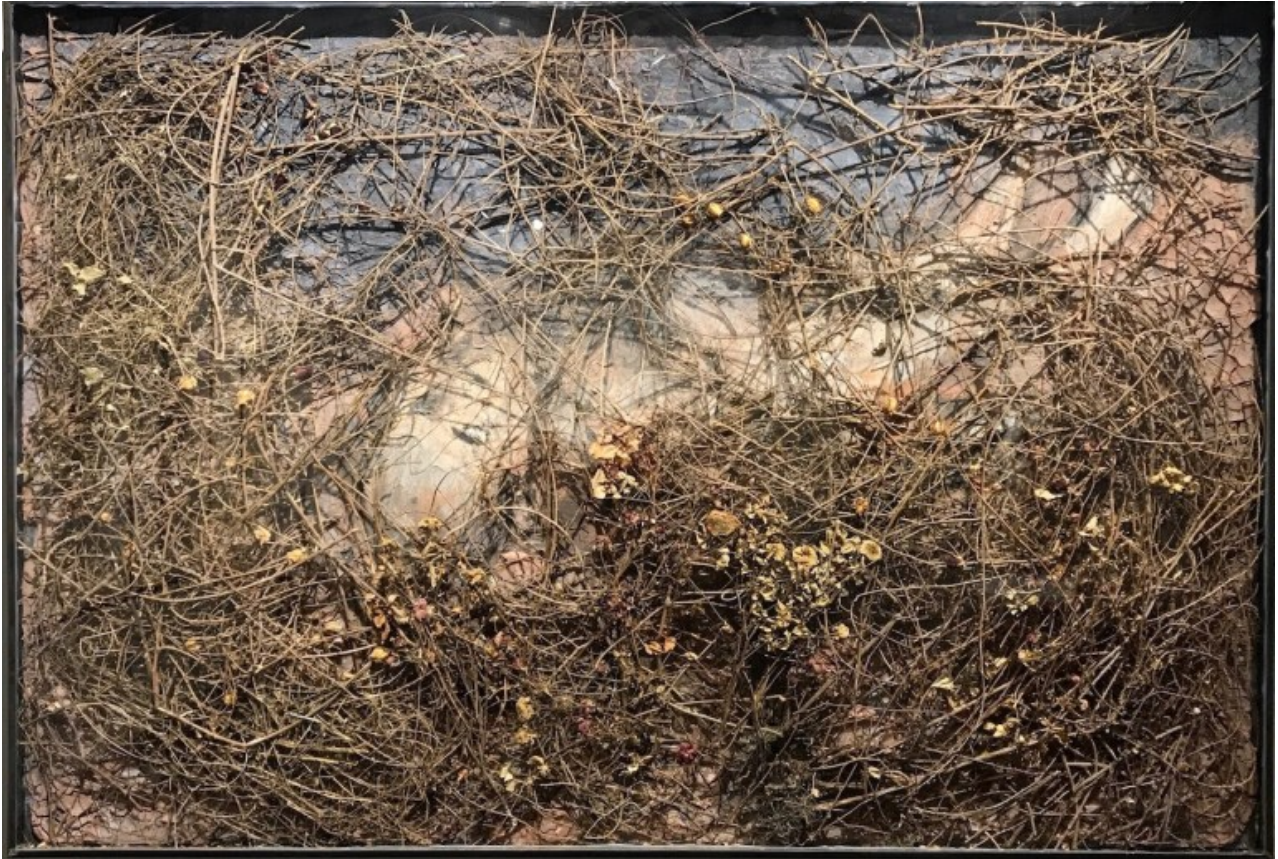
Anselm Kiefer, Sans titre, 2007, argile, huile, acrylique, émulsion, gomme-laque et plantes séchées sur toile sous verre et cadre en acier, oeuvre présentée à l'occasion de l'exposition « Les Voies du Regard », Fondation Gandur pour l'Art, artgenève 2019

Les collections de la Fondation sont régulièrement exposées à travers le monde mais c'est la première fois que ces oeuvres sont présentées ensemble en Suisse. Certaines pièces faisant partie de la collection ethnologie n'ont d'ailleurs jamais été présentées au public.