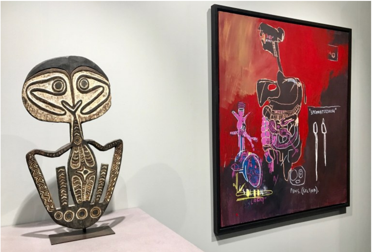
Crochet porte-crânes, Papouasie-Nouvelle-Guinée, aire Kerewa, fin XIXe – début XXe, bois et pigments // Jean-Michel Basquiat, Untitled (Spermatozoon), 1983, acrylique et crayon gras sur toile. Oeuvres présentées à l'occasion de l'exposition « Les Voies du Regard », Fondation Gandur pour l'Art, artgenève 2019