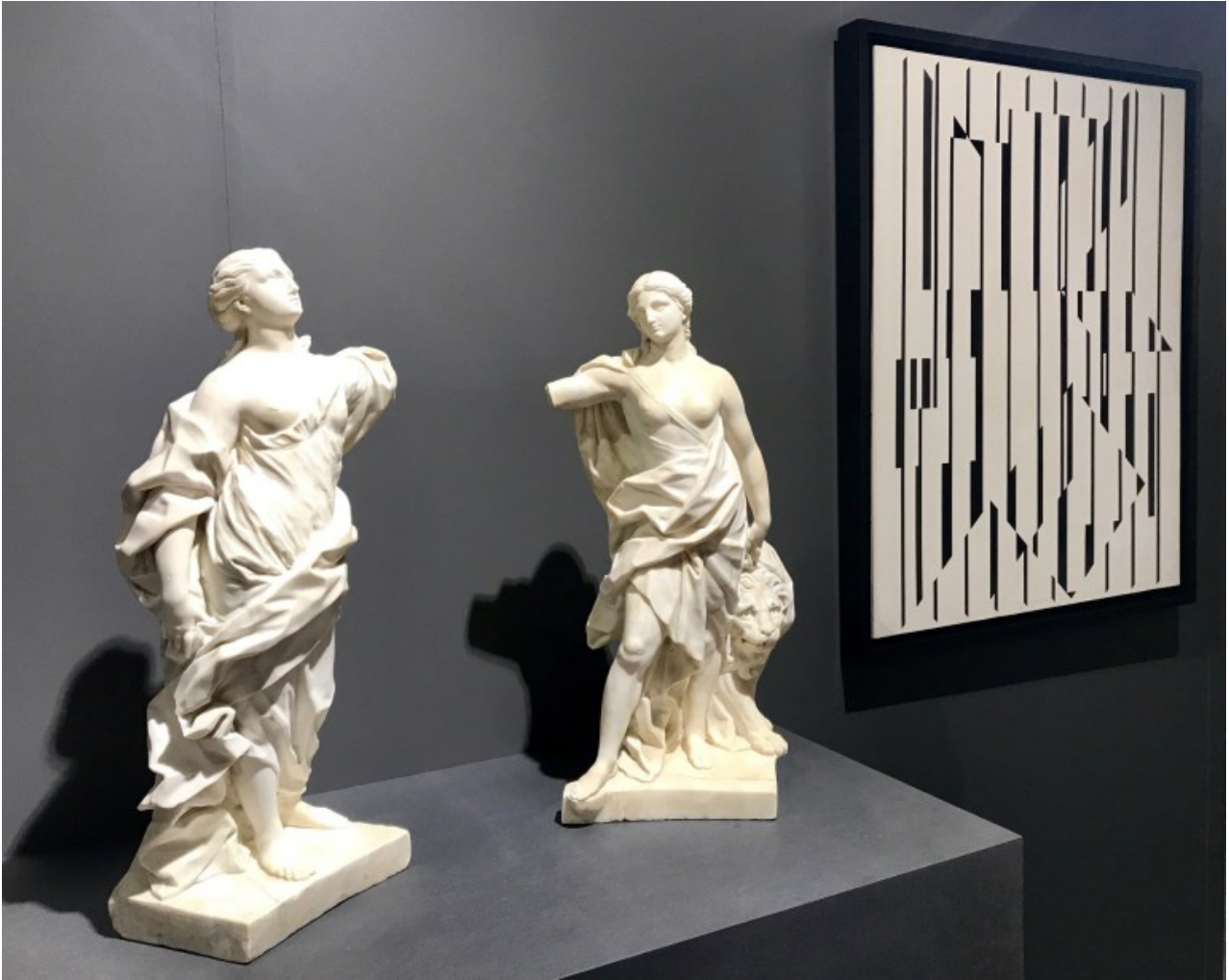
Guillaume II Coustou, Figures allégoriques, 1753, marbre de Carrare // Victor Vasarely, Altaï-pos, 1955-1959, peinture vinylique sur panneau de bois. Oeuvres présentées à l'occasion de l'exposition « Les Voies du Regard », Fondation Gandur pour l'Art, artgenève 2019