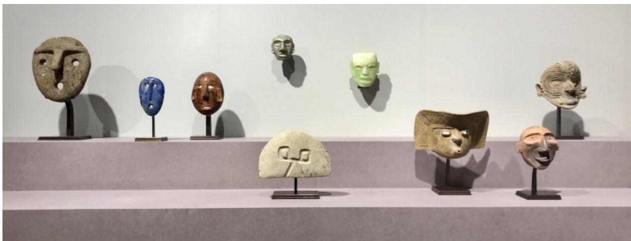
Série de masques anthropomorphes (origines: Mexique, Colombie, Argentine) présentés à l'occasion de l'exposition « Les Voies du Regard », Fondation Gandur pour l'Art, artgenève 2019