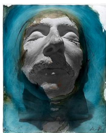
«Unbekannt IV (Totenmaskenserie)», 1978.

● Grimaces, masques et grands esprits fascinent Arnulf Rainer. Depuis une soixantaine d'années, l'artiste autrichien né en 1929 a développé un art du «recouvrement» («Übermalung»), pour rendre un hommage courroucé aux maîtres de la peinture, du dessin ou de l'estampe. D'œuvres préexistantes, faites par des tiers ou par lui-même, il brouille le motif à l'huile, au crayon graphite ou à la cire, dans un geste rageur accompagné de cris. Il enduit des autoportraits au photomaton, où, sous le trait orageux, il apparaît tour à tour bouffon ou tragique;