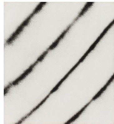
Martin BARRÉ, 67-Z-12-80x72 (série Zèbres, 1967), 1967.