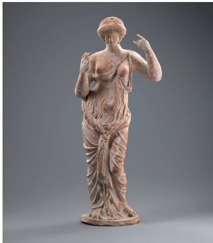
Statuette d'Aphrodite, terre cuite Empire romain oriental, 1 er siècle après J.-C. Collection Fondation Gandur pour l'Art, Genève